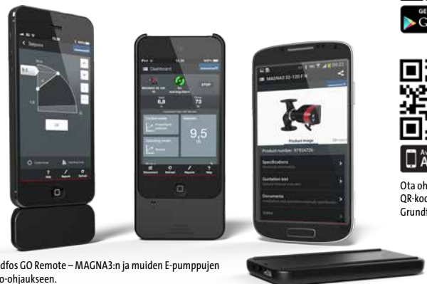
Grundfos GO Remote – MAGNA3:n ja muiden E-pumppujen kauko-ohjaukseen.

Grundfos GO Remote muuttaa mobiililaitteesi pumpun kauko-ohjaimeksi, jolla pumpun ohjauksen lisäksi saat pääsyn Grundfosin online-työkaluihin tien päällä.