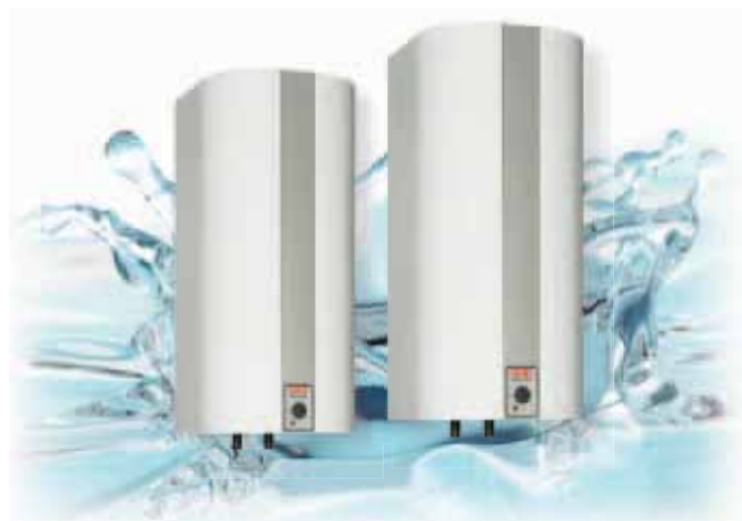
METRO ZENIT RST 60 ja 110 litraa

Rst-varaajien säiliö on ruostumatonta erikoisterästä. Emali-varaajien säiliö on emaloitua terästä ja vastus suojauputuksessa. Suoja-anodin ansiosta emaloitunut varaajat soveltuvat erityisesti kalkkisiin sekä suolaisiin vesiin.